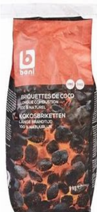
011-0300-003 Boni Kokosbriketten € 5,75 3 KG