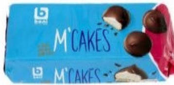
009-1000-001 Boni Melo Cakes € 2,95 340 Gram