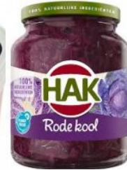
007-0302-013 Hak Rode Kool € 1,80 335 Gram