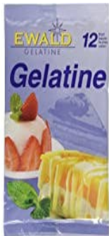
008-1101-001 Ewald Gelatine € 2,15 20 Gram