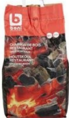
011-0300-001 Boni Houtskool € 11,15 6 KG