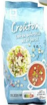
012-0200-007 Boni Croutons € 1,50 75 Gram