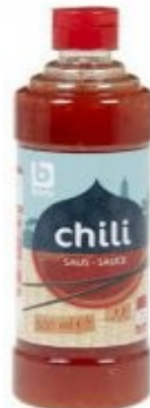
013-0100-003 Boni Chilisaus € 5,15 500 ML