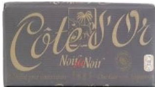
009-0400-001 Cote D'Or Noir de Noir € 3,10 150 Gram