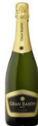
005-1104-003 Cava Gran Baron € 8,50 75 CL