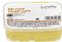
001-0101-013 Everyday Kip Curry € 1,90 250 Gram