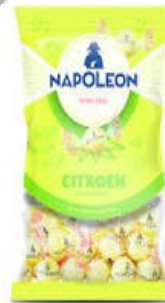
009-0200-001 Perversco Napoleon Lempur € 3,35 340 Gram