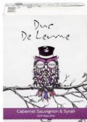
005-1102-021 Colruyt Group Duc De Lerne € 18,95 3 Liter