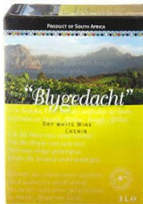
005-1101-002 Colruyt Group Blygedacht Wit € 18,95 3 Liter