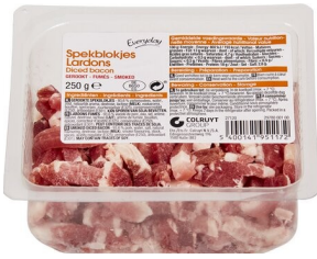
016-0300-001 Everyday Spekblokjes € 2,50 250 Gram