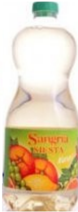
005-0700-012 Siesta Sangria Wit € 4,30 1,5 Liter