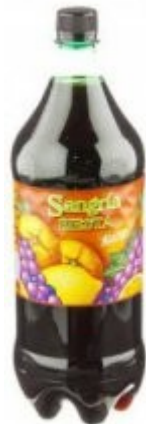
005-0700-011 Siesta Sangria Rood € 3,40 1,5 Liter