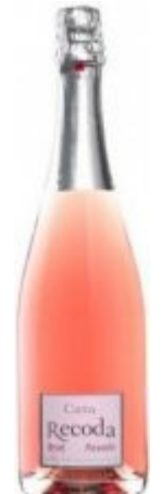
005-1104-001 Cava Recoda Rosato € 7,50 75 CL