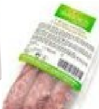
016-0300-002 Sint-Joris Droge Worstjes € 3,30 3 x 50 Gram