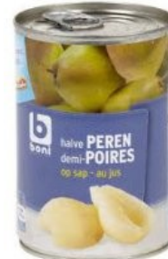
007-0202-006 Boni Halve Peren € 2,20 441 Gram