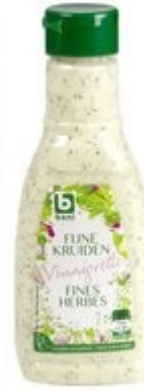
013-0700-001 Boni Vinaigrette Fijne Kruiden € 3,50 450 ML