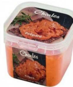
001-0102-001 Charles Prepare € 3,70 185 Gram