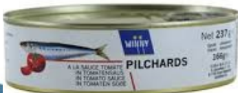
015-0100-004 Winny Pilchards € 2,80 225 Gram