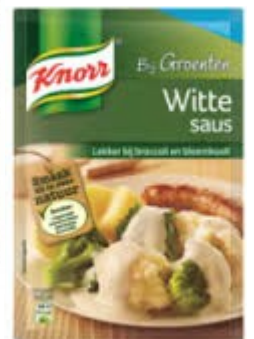
013-0800-005 Knorr Witte Saus € 4,50 4x28 Gram