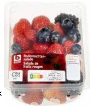
007-0201-012 Boni Rode Fruitmix € 3,40 230 Gram

↓ Ons uitgebreid gamma vind u steeds actueel op onze website