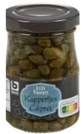
007-0303-005 Boni Kappertjes € 2,30 100 Gram