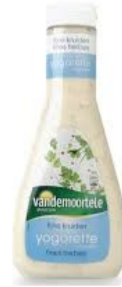
013-0700-003 Vandemoortele Yogurette Fijne Kruiden € 4,20 450 ML