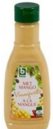
013-0700-002 Boni Vinaigrette Mango € 3,50 450 ML