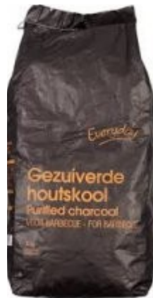
011-0300-002 Everyday Houtskool € 14,10 10 KG