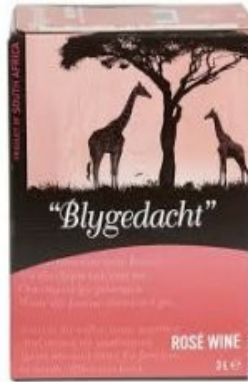
005-1103-004 Colruyt Group Blygedacht Rosé € 18,95 3 Liter