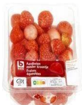
007-0201-013 Boni Aardbeien € 3,40 230 Gram