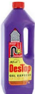
010-0600-007 Redit Destop Gel Express € 6,80 1 25 l iter