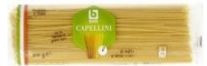
008-0800-018 Boni Cappellini € 1,20 500 Gram