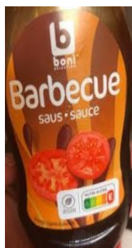
013-0400-022 Boni BBQ Saus € 2,25 300 ML