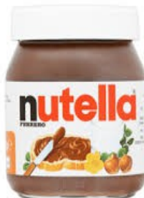
012-0701-002 Nutella Chocopasta € 4,15 400 Gram