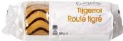
009-1000-007 Everyday Tijgerrol € 3,60 150 Gram