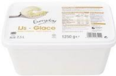
Everyday Vanilleroomijs € 3,25 2,5 L