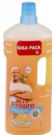
P&G Mr. Proper Allesreiniger Agrums € 5,15 250 ML