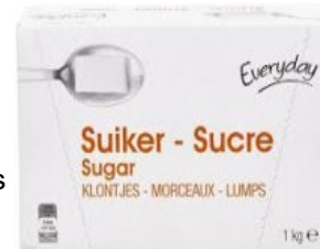
Everyday Suikerklontjes € 2,10 1 KG