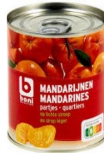
Boni Mandarijnen € 1,80 312 Gram