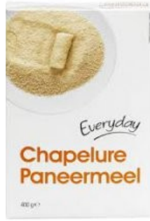
Everyday Paneermeel € 0,80 400 Gram