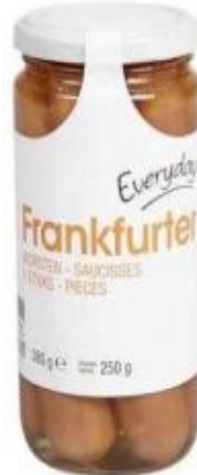
Everyday Frankfurter € 2,20 380 Gram