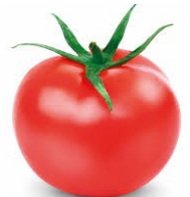
Tomaat € 0,50 Stuk