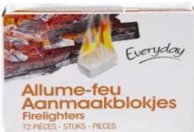
Everyday Aanmaak- blokjes € 2,20 72 Stuks