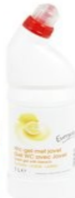
Everyday WC Gel Citroen € 1,85 1 Liter