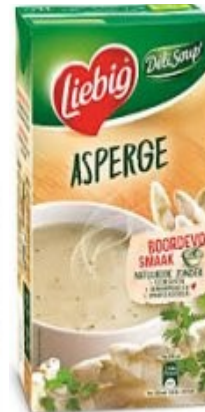
Liebig Aspergesoep € 5,55 1 Liter