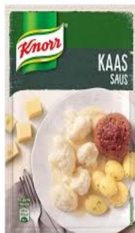
Knorr Kaasaus € 4,50 4x22 Gram