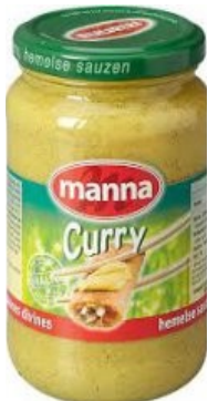
Manna Currysous € 2,30 330 Gram