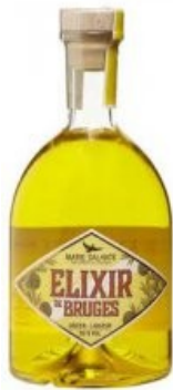
Marie Galante Elixir de Bruges € 19,75 70 CL