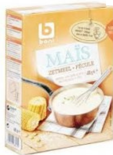
Boni Maiszetmeel € 2,25 400 Gram