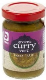
Boni Groene Currypasta € 2,10 100 Gram