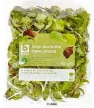
Boni Jonge Slascheutenen € 1,90 100 Gram