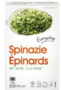
Everyday Spinazie € 1,15 450 Gram