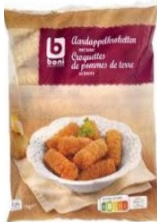
Boni Krokettekzak € 3,50 1 KG