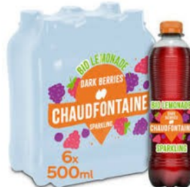
005-0301-026 Coca Cola Bio Limo Bosvruchten € 9,95 6x50 CL

Beste Klanten, Na veel wikken en wegen hebben we besloten om onze openingsuren aan te passen vanaf 8 juli. Jammer genoeg moeten we concluderen dat een maandagnamiddag in het verleden meer effect heeft dan op een zondagvoormiddag te openen, daarom daarin de grootste switch binnen onze uren, om u goed tot dienst te zijn zullen we ook op maandag open zijn tot 18u30 en op zaterdag tot 13u30 OPENINGSUREN (vanaf 8 juli) Maandag 14:00-18:30 Dinsdag 07:00-18:30 Woensdag 07:00-18:30 Donderdag 07:00-18:30 Vrijdag 08:00-17:00 Zaterdag 08:00-13:30 Zondag en Feestdagen Gesloten