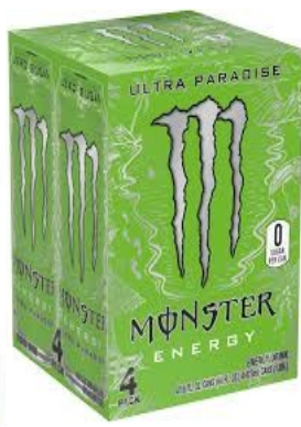
005-0303-004 Coca-Cola Monster Energy € 9,10 4x50 CL