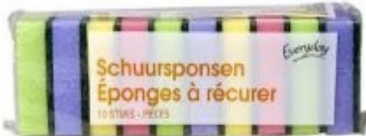
010-0700-001 Everyday Schuurspansen € 0,90 1x10 Stuks

Beste Klanten, Na veel wikken en wegen hebben we besloten om onze openingsuren aan te passen vanaf 8 juli. Jammer genoeg moeten we concluderen dat een maandagnamiddag in het verleden meer effect heeft dan op een zondagvoormiddag te openen, daarom daarin de grootste switch binnen onze uren, om u goed tot dienst te zijn zullen we ook op maandag open zijn tot 18u30 en op zaterdag tot 13u30 OPENINGSUREN (vanaf 8 juli) Maandag 14:00-18:30 Dinsdag 07:00-18:30 Woensdag 07:00-18:30 Donderdag 07:00-18:30 Vrijdag 08:00-17:00 Zaterdag 08:00-13:30 Zondag en Feestdagen Gesloten