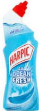
010-0600-009 Harpic Ocean Fresh € 2,95 750 ML