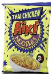
001-0202-005 Aiki Noodles Thai Chicken € 2,35 82 Gram