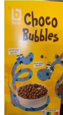
012-0400-005 Boni Choco Bubbles € 4,10 750 Gram