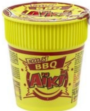
001-0202-008 Aiki BBQ Noodles € 2,30 70 Gram