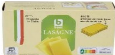
008-0800-012 Boni Lasagnebladen € 2,95 500 Gram