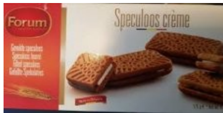
012-0500-004 Forum Speculoos Crème € 2,40 175 Gram