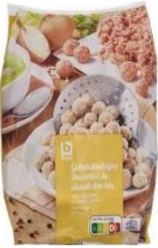
016-0200-011 Boni Soepballetjes € 8,40 1 KG