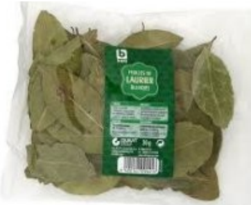
008-0600-023 Boni Laurier € 2,80 20 Gram